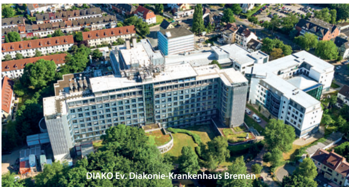
DIAKO Ev. Diakonie-Krankenhaus Bremen